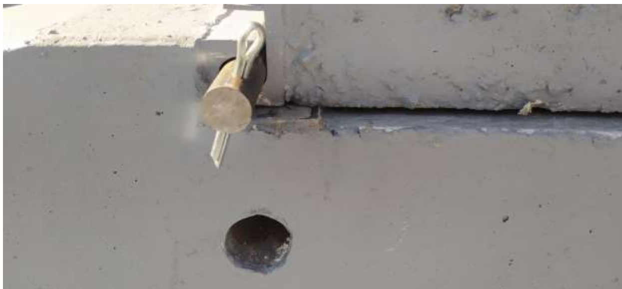
Рисунок 5 - Процесс сборки стойки и плиты