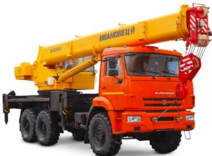
Рисунок 4 – Основные применяемые машины

Автомобильный кран приведен на рисунке 4.