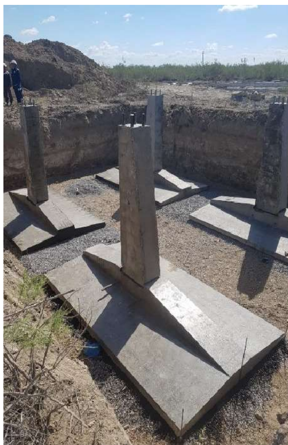
Рисунок 6 – Установка сборного фундамента