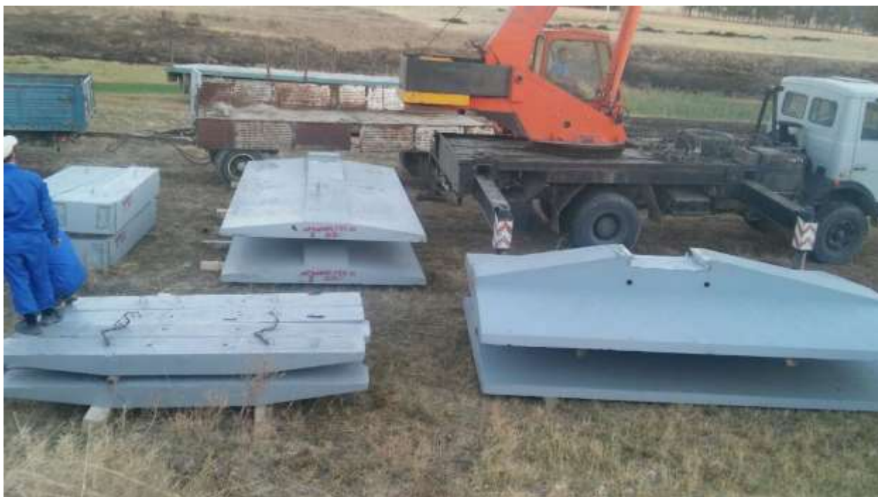
Рисунок 3- Складирование сборных фундаментов